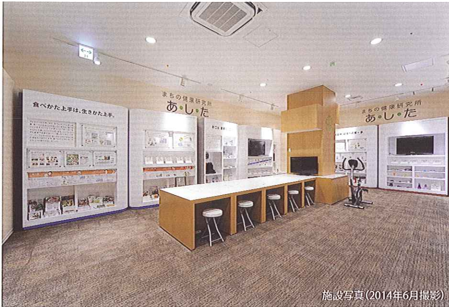
施設写真(2014年6月撮影)

まちの健康研究所「あ・し・た」は、東京大学と企業の協力によって誕生した、まちの健康づくり拠点です。施設内にはそれぞれ5つのテーマで健康を追求したブースをご用意。おなかに赤ちゃんのいるお母さんから、小さなお子さん、お年寄りの方まで、どの年代にも役に立つ健康のコツをご提供します。また、健康に関する各種イベントも開催いたします。基本利用料は無料。お友達と、ご家族と、何度でもお気軽にご利用ください。